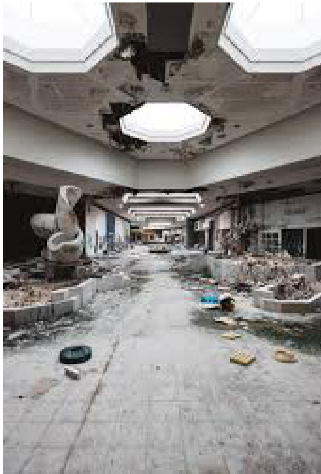
● Εγκαταλελειμμένο πολυκατάστημα στις ΗΠΑ

Λόγω της ταχύτατης ανάπτυξης της σύγχρονης κοινωνίας, σπανίζει πια ο χρόνος που είναι αναγκαίος στους ανθρώπους για να κάνουν αυτά τα οποία τους προσφέρουν πραγματική χαρά.